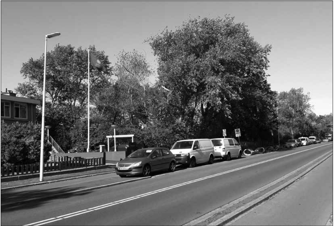
De parkeerstrook op het Duindorpgedeelte van de Nieboerweg, waar binnenkort ook moet worden betaald

is gebleken dat zo'n zestig procent van de daar geparkeerde auto's afkomstig is uit andere buurten dan Duindorp. Er zijn op die strook overigens geen auto's uit de Vogelwijk gesignaleerd.