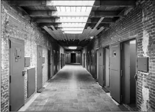
Cellengang met o.a. Doodencel 601

De recente restauratie van het oude cellencomplex van de Scheveningse gevangenis dat in de oorlogsjaren '40-'45 de bijnaam Oranjarahotel kreeg, heeft in de media veel aandacht gekregen. Op 7 september heeft koning Willem-Alexander het geopend als Nationaal Monument en Herinneringscentrum. Hier werden in de bezettingstijd ruim 25.000 Nederlanders verhoord en berecht, veelal omdat ze tegen de Duitsers in verzet waren gekomen. Een vaste presentatie, Doodencel 601 en filmmateriaal geven een beeld van deze geschiedenis, de verschillende groepen gevangenen en het leven in deze belangrijkste Duitse gevangenis op Nederlands grondgebied. In de